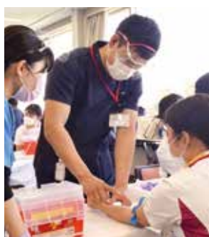
▲静脈注射の練習をする研修医

これからの地域医療を守るには、若い力が必要です。当院では今後も人材育成に励んでいきます。