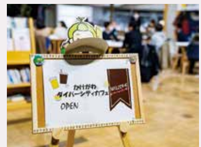
▲ダイバーシティカフェを2月に開催

前回開催の2月は「働く×学ぶ×ダイバーシティ」をテーマに対話しました。今後の開催は市ホームページからご確認ください。