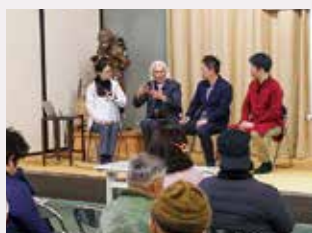
ダイバーシティカフェ▶