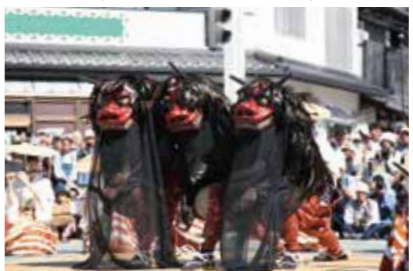
瓦町のかんからまち 12日～14日(昼間) お祭り広場登場14日(月・祝)12:30～12:45

大名行列を模した西町の奴道中は、「下に、下に」のかけ声とともにやってきます。白ちりめんの襟をあしらった黒繻子の法被をまとい、大名の荷物道具を担いだ奴は、列をなして掛川の街中を練り歩きます。