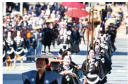
西町の奴道中 12日～14日(昼間) お祭り広場登場13日(日)14:15～14:30

大名行列を模した西町の奴道中は、「下に、下に」のかけ声とともにやってきます。白ちりめんの襟をあしらった黒繻子の法被をまとい、大名の荷物道具を担いだ奴は、列をなして掛川の街中を練り歩きます。