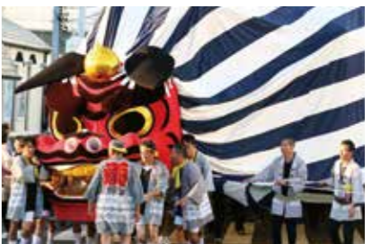
仁藤町の大獅子 13日・14日(昼間) お祭り広場登場14日(月・祝)15:25～15:45

行列と獅子舞から成る瓦町の伝統神事芸能。2頭の雄が1頭の雌を巡って競い合い、神の前で和合するという筋書きで3頭の獅子が笛に合わせて優雅に、躍動的に舞います。静岡県無形民俗文化財第一号に指定されています。