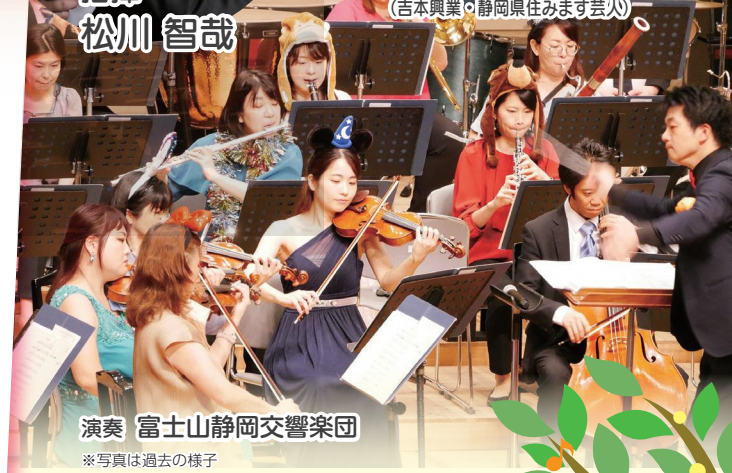
演奏 富士山静岡交響楽団