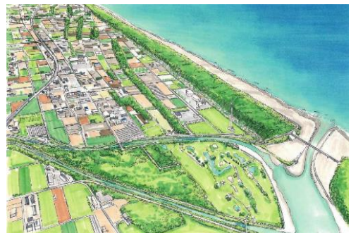
潮騒の杜イメージ

盛り土や植樹などの工事から維持管理までを、市民・企業との協働と、国や県などの事業との連携、協力により行い、次世代を担う若者や子どもたちが集う「掛川潮騒の杜」づくりを推進しています。