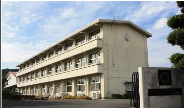
校舎等の外観写真