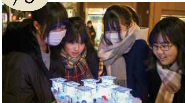
▲展示作品を鑑賞する通行人

掛川の冬を彩る「第26回ひかりのオブジェ展」が、駅北口で開催されています。初日は掛川東中学校吹奏楽部によるコンサートや点灯式を実施。市民や企業、児童、学生、地元商店街などが作製した約70作品が展示されています。1月23日までの開催です。