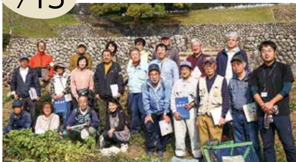
▲国指定史跡 横須賀城跡を楽しむ参加者

「史跡磨き上げプロジェクト」が横須賀城跡で開催されました。参加者は、歴史ある城跡を楽しみながら遺構に生えた雑草や低雑木などの撤去作業に取り組み、市学芸員による城跡解説ツアーでは熱心に耳を傾けていました。