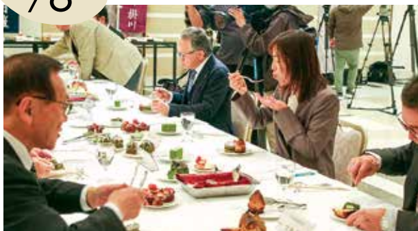
▲試食をする実行委員

1月11日から二の丸茶室で行われる王将戦第1局。棋士に提供される「勝負めし・おやつ」が披露され、掛川市将棋によるまちづくり実行委員が試食を行いました。おやつは市内事業者に公募し集まった18品が勢揃い。当日どのメニューが選ばれるか注目です。