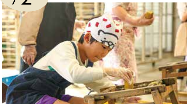
▲干し芋製造工程に挑戦する児童

横須賀小学校3年生が「株式会社おいもや」の工場見学を実施しました。干し芋製造の工程を学び、昔ながらの「つき台」を使って芋を切る体験にも挑戦! 地域で働く人の思いや気持ちを感じることができました。地元の特産品への理解と愛着を深める貴重な機会となりました。