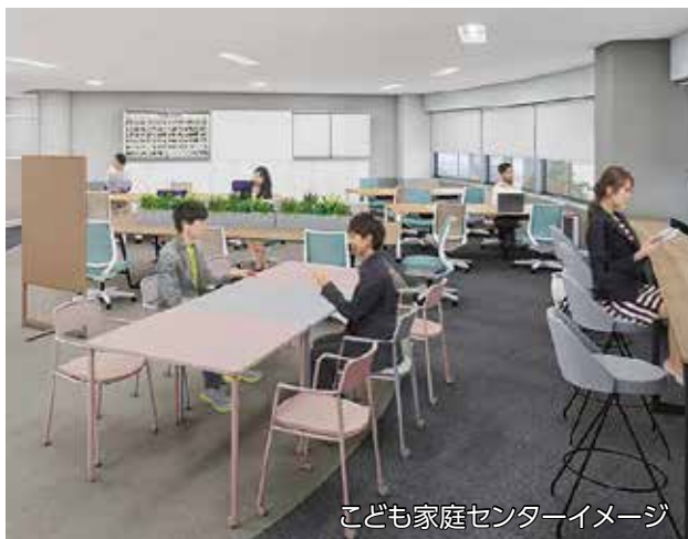
こども家庭センターイメージ