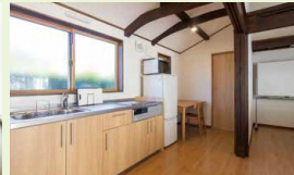
キッチン / 談話室のすぐ横に設けられたキッチン

企業が空き家を取得し、研修拠点へ再生。 地域と人材、全国の従業員をつなぐ活用モデル。