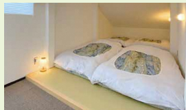
2階の学生寮 / 近隣の大学と連携したアトリエ併設の学生寮