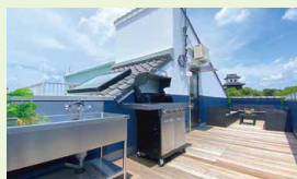
屋外テラス / 屋上ではBBQも楽しめる滞在空間に