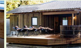
サムライサウナ / ウッドデッキに設置した木製サウナ

掛川市上内田の里山に建つ築50年の古民家を改修した「リノベーションモデルハウスU10」。DWELLとの協働によるキッチンや半外空間「GOOD-TIME PLACE」、ウッドデッキのサウナなど、暮らしの楽しさを体験できる泊まれる設計も特徴です。能登震災でレスキューされた梁材や古建具の再利用など、資源循環の思想も取り入れています。また、上内田地域の事業者と協働したイベントや体験を展開し、地域全体を巡る新しい人の流れを生み出しています。