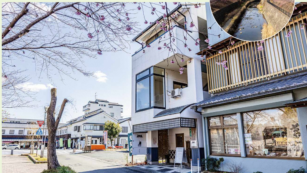
外観 / 掛川城と逆川に寄り添う城下の空き家を再生