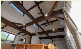
談話室 / 古い梁を生かしつつ、必要な補強を実施