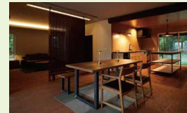
リビング / 自然素材に包まれた 開放的な室内空間