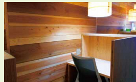
固定席 / 集中できる半個室型の固定席エリア