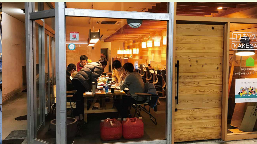
外観 / 連雀商店街の空き店舗を再生した拠点