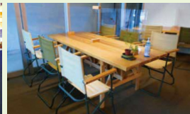
打合せスペース / 入居者同士の交流が生まれる場

掛川駅と掛川城の間に位置する連雀商店街の空き店舗を改修し、働く場として再生した「コワーキングスペースKAKEGAWA」。NPO法人かけがわランド・バンクが運営し、フリー席や固定席、個室オフィスを備えた仕事拠点として整備されました。24時間利用可能で、起業家やフリーランス、企業のサテライト拠点など多様な働き方を支えています。商店街の空き店舗を活用し昼間人口を増やすことで、まちなかのにぎわい再生を目指す取り組みでもあります。働く人が街中に流れ、交流や新たな事業を生み、地域活性化へつながるモデル事例です。