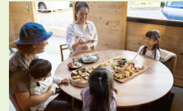
GOOD-TIME PLACE / 内外がつながる半外空間の居場所