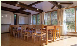
談話室 / 2階の床を取り払い、 天井が高い広々とした空間を構築