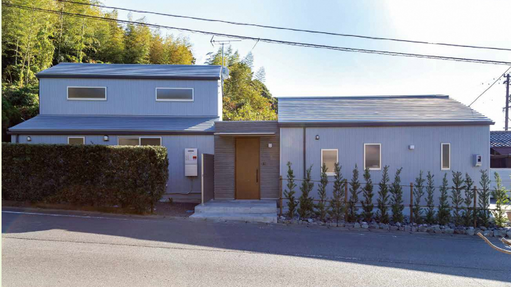
外観全景 / 屋根と壁の素材、デザインが変わりイメージを一新