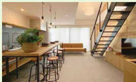
室内 / 宿泊と交流を生むシンプルな室内空間

掛川城の目の前、逆川沿いに建つ空きビルを改修し、宿泊と交流の拠点として再生した「JOKA BASE」。2階は学生寮とアトリエ、3階は簡易宿所（民泊）として整備され、移住体験や地域滞在の受け皿となっています。屋外テラスや屋上からは掛川城と掛川桜を望み、城下町の風景を身近に感じられる立地も魅力。NPO法人かけがわランド・バンクと掛川市が連携し、若者や来訪者をまちなかへ呼び込むモデル事業として整備されました。空き家を地域の未来につなぐ拠点へと転換した、大学生も巻き込んだ再生モデルです。