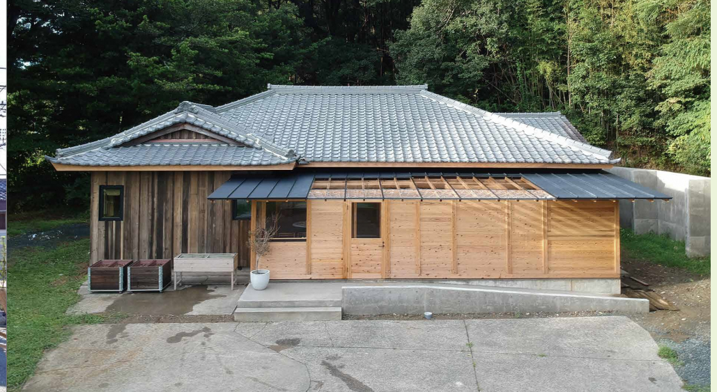
外観 / 里山の風景に佇む築50年の古民家

静岡県掛川市内の空き家をSUS株式会社が取得し、研修施設として再生した「SUS掛川・空き家プロジェクト」。人材育成・交流の場として活用するとともに、地域の空き家課題の解決にも貢献する取り組みです。元の建物は、1961年築の2階建てと、増築された1977年築の1階建てを渡り廊下で連結した構造で、木造の梁や柱を活かしながら改修されました。宿泊を伴う研修や交流活動に対応できる施設へと整備されました。