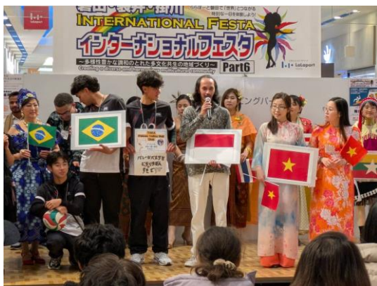
インターナショナルフェスタの様子