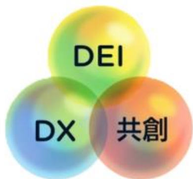
総合計画基本理念のイメージ

かけがわしたぶんかきょうせいすいしん かけがわしろうごうけいかく しずおかけん 掛川市多文化共生推進プランは、掛川市総合計画と静岡県 たぶんかきょうせいすいしんきほんけいかく せいごうせい はか 多文化共生推進基本計画と整合性を図っています。