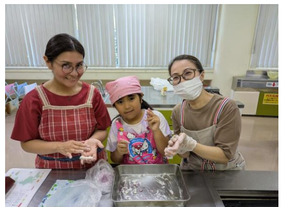
ワールドクッキングの様子