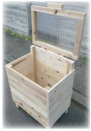
生ごみ処理機「キエーロ」

それでも生ごみが出てしまったら… 生ごみ処理機を使って、さらにゴミ減量を進めませんか?