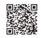
補助金情報はこちら