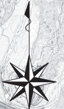
付図 1号 土地利用計画図