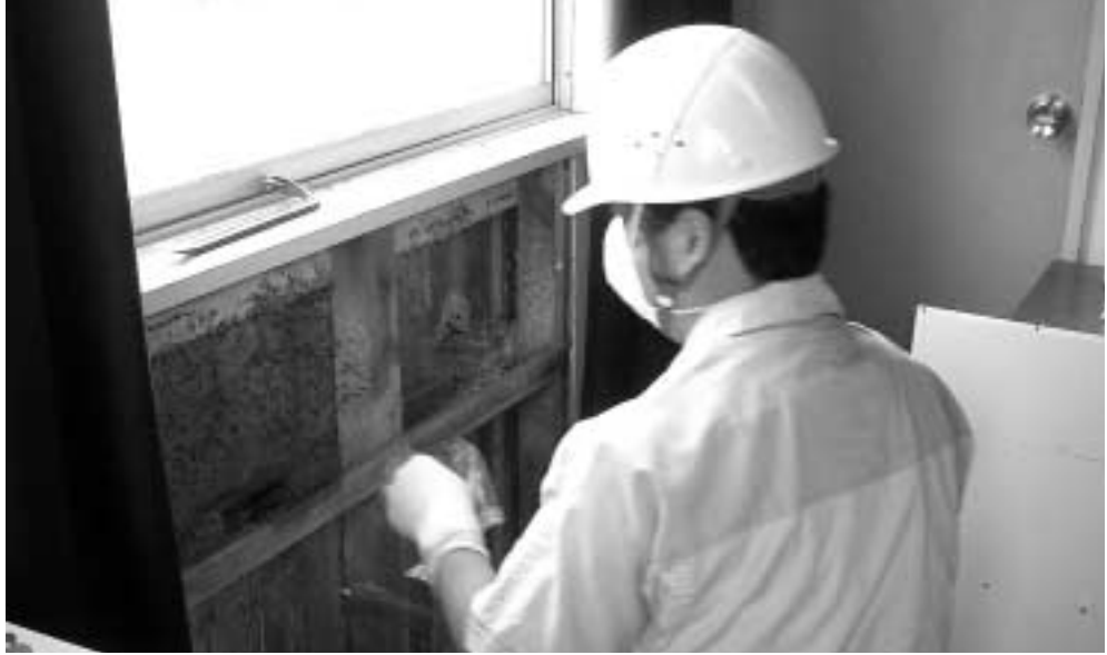
公共施設におけるアスベストのサンプル採取