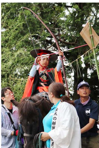
▲勇壮に流鏝馬の儀式を行う子ども

垂木の祇園祭(市無形民俗文化財)が7月7日から8日間、桜木地区で開催されました。今年は改元を記念し6年ぶりの流鏝馬神事が披露されました。