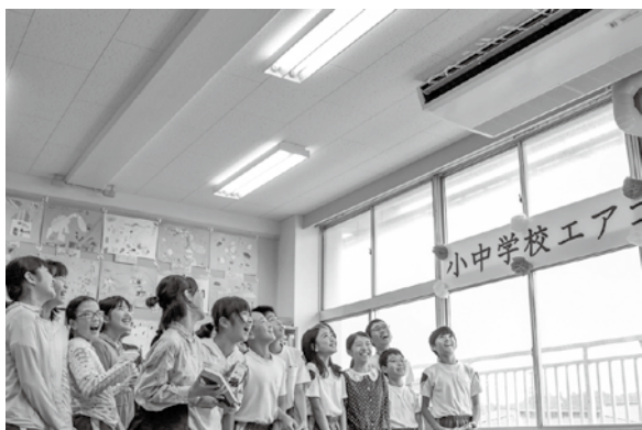
▲市は、市内全ての小中学校普通教室と幼稚園保育室にエアコンを設置。6月1日から一斉に使用を開始しています。

以前とは、環境も勉強の内容も変化している中で、環境衛生基準も変わりました。学校薬剤師も先生とともに学校の環境を調べています。