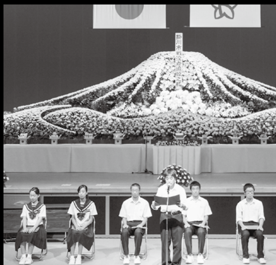
▲平成30年度平和祈念式で平和への思いを語る中学生たち

英霊への感謝の気持ちを忘れず、平和の尊 さと悲惨な戦争の記憶を後世に語り伝えるた め、戦没者追悼式および平和祈念式を行いま す。家族と平和について考える機会としてご 参加ください。