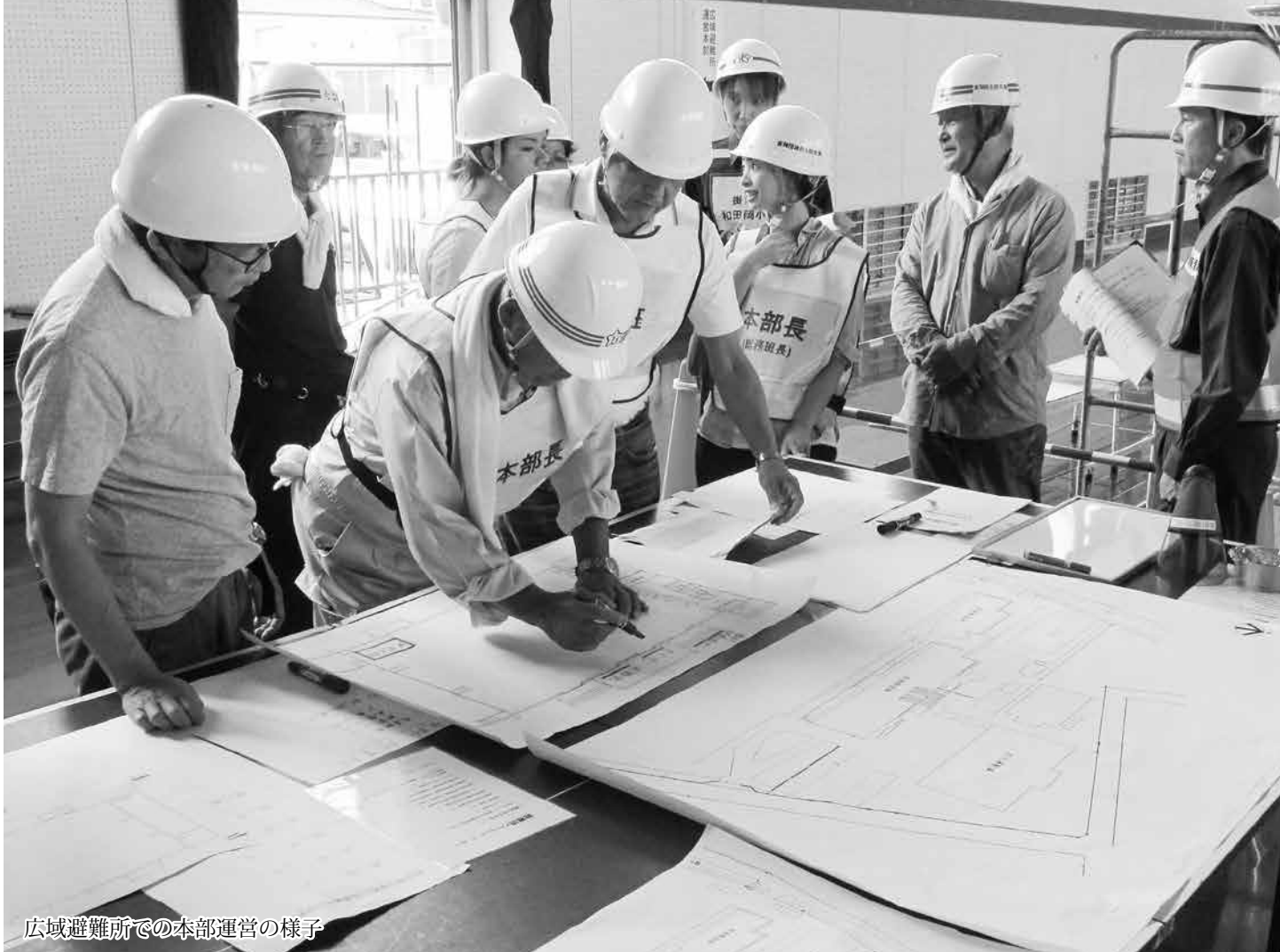
広域避難所での本部運営の様子