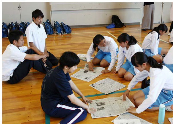
▲新聞紙スリッパを作る応急措置班役の生徒ら

生徒や教職員、地域住民の防災意識の向上と災害時の地域防災リーダーの育成を図るため、横須賀高校で避難所運営体験が行われました。