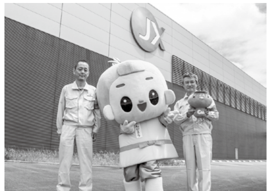
▲山西工場長(右)と中川総務担当課長(左)

菖蒲ヶ池 JX金属プレジジョンテクノロジー 車載用コネクタなどの精密部材を製造 世界が認める1ミクロンの微細加工技術