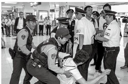
▲騒ぐファン役の男性を抱え上げる警察官ら