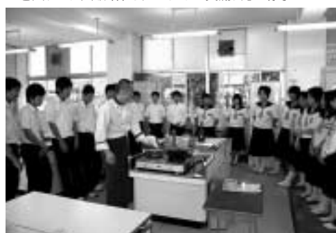
掛川青年会議所「キャリア教育」の様子

【第2部】 取り組み発表(午前9時30分～) ・掛川市老人クラブ連合会の取り組み ・掛川青年会議所の取り組み