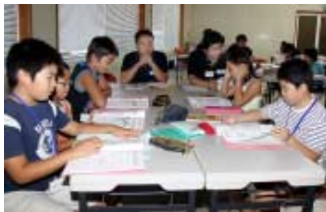
◀真剣に課題に取り組む小学生

掛川商工会議所で、同青年部と掛川青年会議所主催の子ども起業体験塾が開催されました。これは、模擬的な起業体験を通して、チームで考え、協力し、行動する力を養うことを目的とし、県内初の試み。子どもたちは、約3か月間かけて、社会のしくみを学びます。