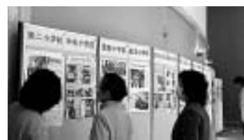
平成21年度展示の様子

主催 「かけがわ教育の日」実行委員会、掛川市教育委員会 協力 「かけがわ教育の日」協力団体協議会