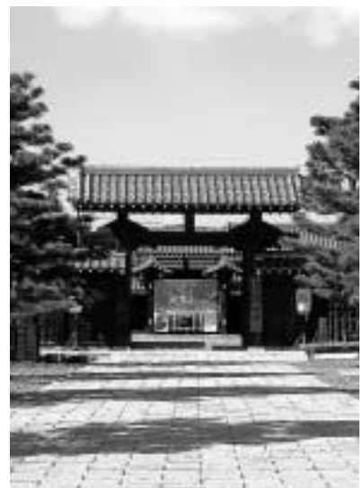
気賀関所(気賀駅から徒歩3分)

詳しくは、天竜浜名湖鉄道ホームページ( http://www.tenhamaco.jp/ )または営業課( ☎053-925-2276 )へお問い合わせください。