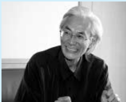
掛川市土生生まれ。前東京学芸大学学長 専門はドイツ文学・社会思想史