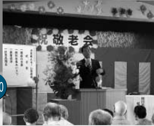
小笠老人ホーム敬老会(9月5日)