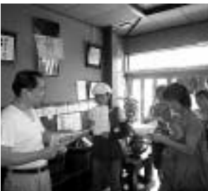
レシピ作りのため熱心に取材

地元調味料「さしすせそ」の5部構成で紹介するレシピ作りを行い、多くの人に地域資源のすばらしさを紹介します。