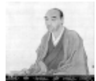
重要文化財 渡辺華山像

渡辺華山とその弟子たち 遠江の南画の師、渡辺華山の作品を中心に、掛川藩お抱え絵師村松以弘などその弟子たちの作品、重要文化財を含む26点を展示