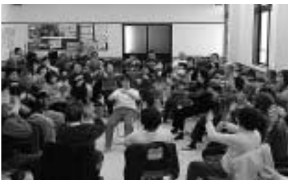
西山口地区福祉協議会 介護予防活動の様子

死亡届を出さず年金を受け取り続けていた家族のモラルの問題はもちろんですが、「核家族化」と「貧困化」がその要因に横たわっているのではないかと考えます。「家族の絆」「地域社会の絆」の希薄化が進めば、このような問題は更に増えていくのではな