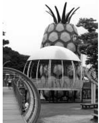
はままつフルーツパーク (フルーツパーク駅から徒歩10分)