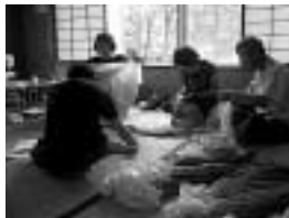
ふるしきを使って衣装作り

音楽、踊り、マジックなど芸をもった元気なシニアグループが、福祉施設、子育て支援施設の要請を受けて訪問し、「楽しさと励まし」の出前配達を行います。