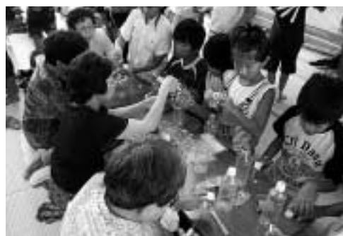
老人クラブ大坂昭和会「ふれあい交流会」の様子

【第1部】 開会行事(午前8時45分～) オープニングアトラクション いきわくジュニアプラスバンドクラブ いきわくジュニアアトリエクラブ 開会行事 「世界一短いメッセージ」優秀作品発表・表彰