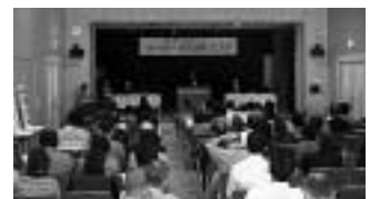
第2回市民活動フェスタの様子

市民活動団体の交流を目的に、市内で活躍する団体が一堂に会して、活動の紹介や交流を行います。