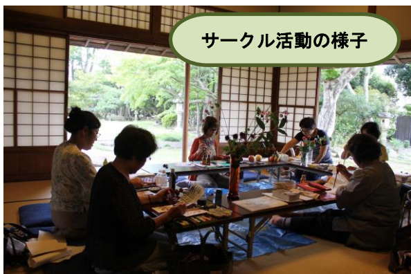
サークル活動の様子

掛川市有形文化財「竹の丸」では、お部屋の貸し出しを行っております。 明治36年に建てられた近代和風建築の中で、会議やサークル活動、撮影会や食事会などにご活用いただいております。多くの皆さまのご利用をお待ちしています。