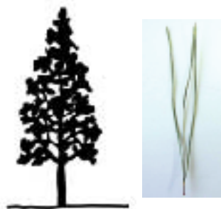
針葉樹の樹形と葉(マツ)

広葉樹の葉は、幅が広く平たくなっています。広葉樹の代表的なものはサクラやクスノキ、エノキなどです。