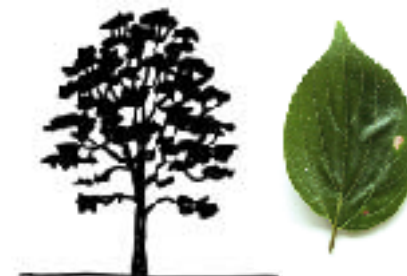
広葉樹の樹形と葉(エノキ)