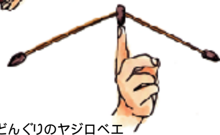
どんぐりのヤジロベエ