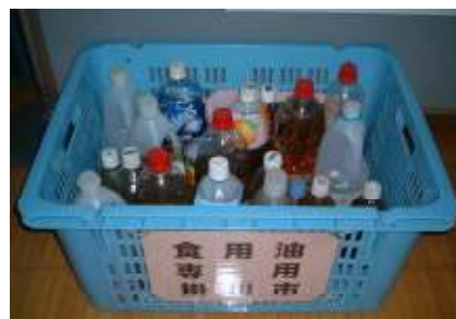
集積所への排出の様子