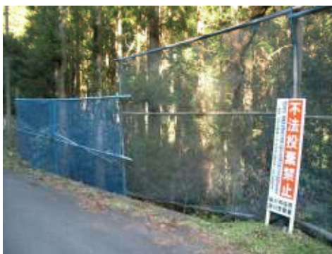
図 ネット・看板設置例

近年外国人による不法投棄が増加してきたことから、掛川市内に最も多く居住するポルトガル語圏の人の不法投棄を防止するため、ポルトガル語の不法投棄禁止看板を作成し配布しています。