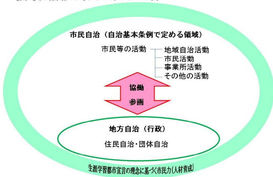
【図1】市民自治によるまちづくりのイメージ図

また、掛川市における市民自治によるまちづくりは、生涯学習都市宣言の理念に基づく市民力の向上（人材育成）の考え方を根幹としています。（図1参照）