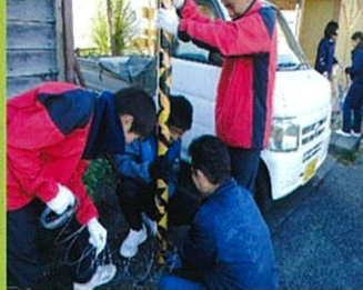
桜木駅清掃(サッカー部)