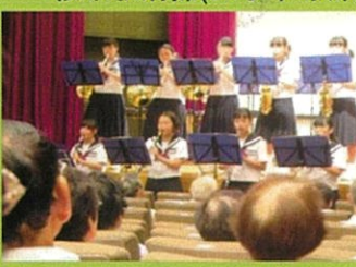
桜木敬老会(吹奏楽部)