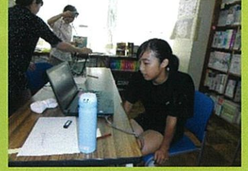
学校図書館(女子バレエ部)