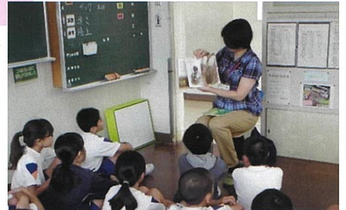
読み聞かせボランティア