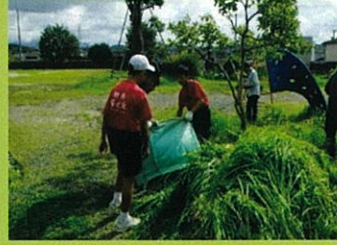
掛川こども園(男子テニス部)