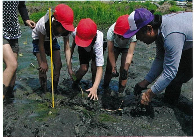
レンコンの植え付け(和田岡小)