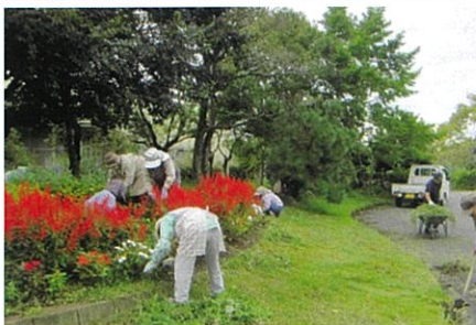
花園ボランティア