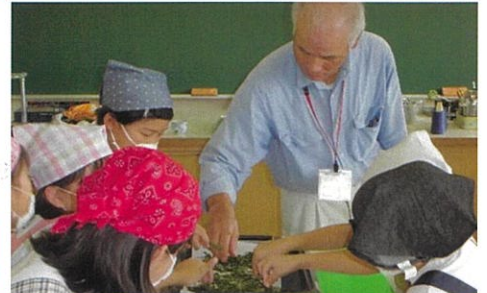
お茶手揉み体験(3年)