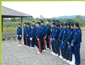
和田岡親水公園(男子バスケ部・ソフト部)