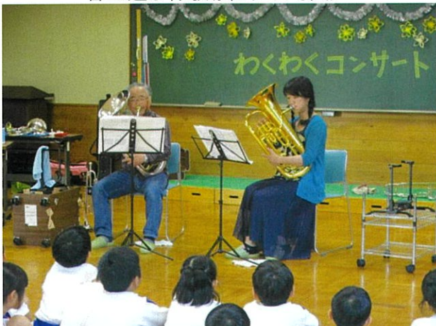
放課後子ども教室・「わくわくコンサート」(桜木小)