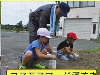
コスモスロード種まき