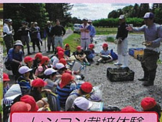
レンコン栽培体験