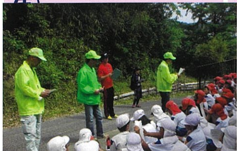
地域学習講師 《ホタルの学習会》(4年)