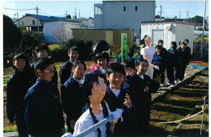
一部一ボラ 桜木駅に案山子を設置しよう(桜が丘中)