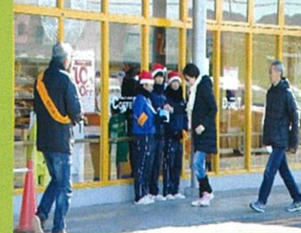
歳末助け合い(ソフト部)