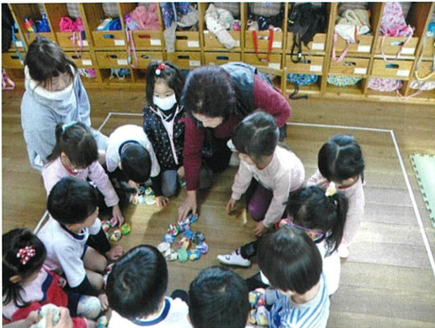
昔の遊び体験(掛川こども園)