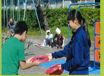
桜木体育大会(女子テニス部)