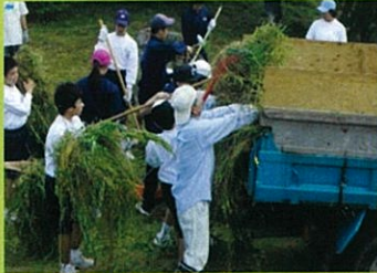
和田岡親水公園(パソコン部) 和田岡福祉館(美術・女子バスケ部)