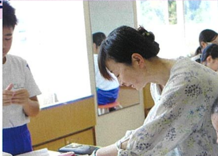
家庭科ミシンボランティア(5・6年)