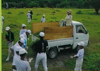
和田岡親水公園(野球部)