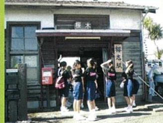
桜木駅清掃(女子卓球部)