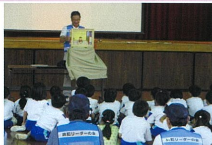
防犯教室「あぶトシ」