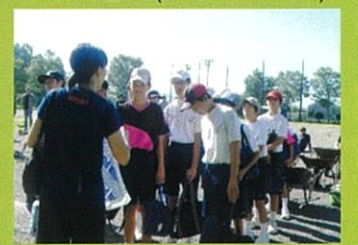
和田岡小(男子卓球部)