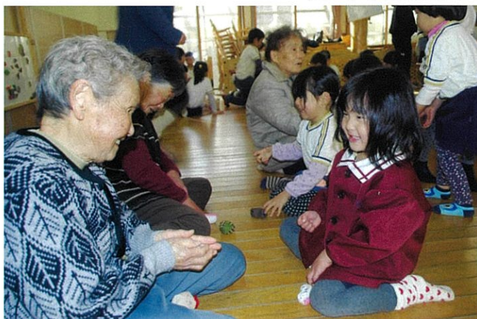
正月遊び(桜木こどもの森)