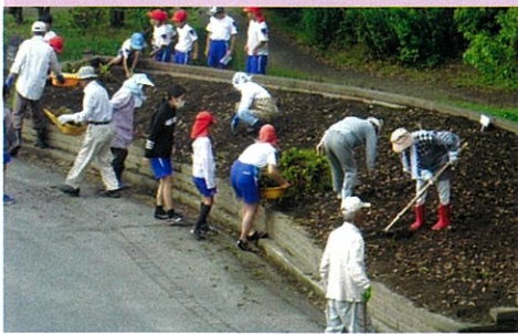
花園ボランティア