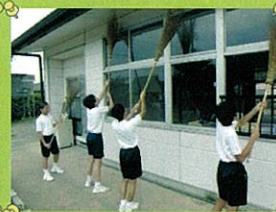
和田岡ふくし館(パソコン)