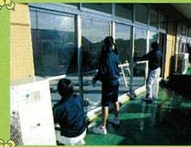
和田岡ふくし館(女バス)