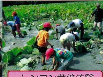
レンコン栽培体験