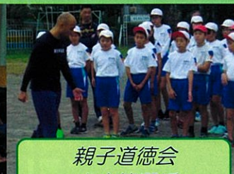
親子道徳会 ～山本篤選手～