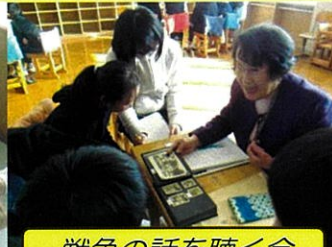
戦争の話を聴く会