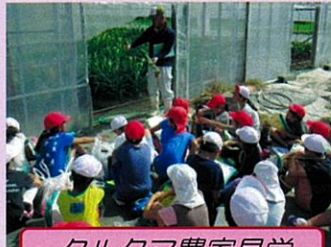
クルクマ農家見学