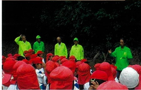
地域学習講師 《ホタルの学習会》(4年)