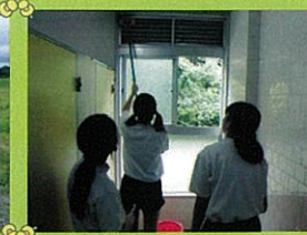
桜木小(生徒会ボランティア)