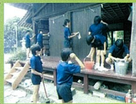
各和八幡神社(女バレ)