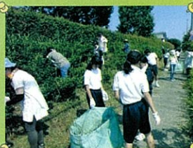
掛川子ども園(美術)