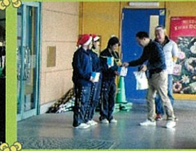
歳末助け合い募金(ソフト)