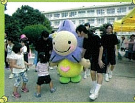
桜木地区体育大会(女卓球)