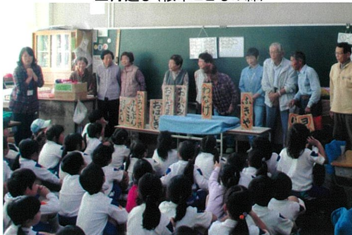
昔の遊び教室(桜木小)