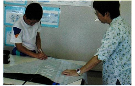
家庭科ミシンボランティア(5・6年)