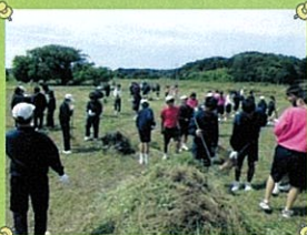
和田岡親水公園(男女テニ)