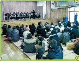
掛川子ども園(吹奏楽部)