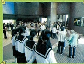
桜木地区敬老会(吹奏楽)