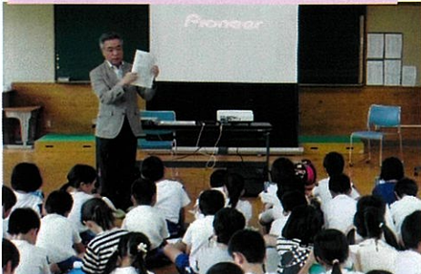
地域学習講師 《垂木の祇園祭》(3年)