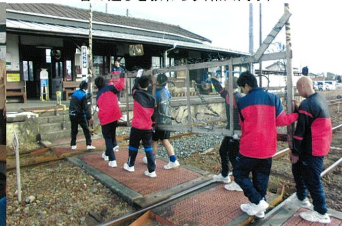
一部一ボラ 桜木駅清掃(桜が丘中)