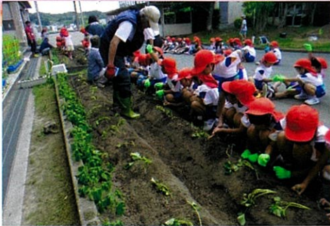
さつまいものつるさし(1年)