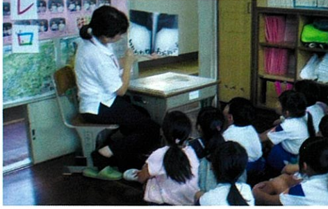
読み聞かせボランティア