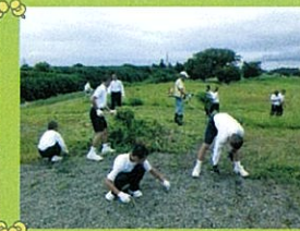
和田岡親水公園(野球)