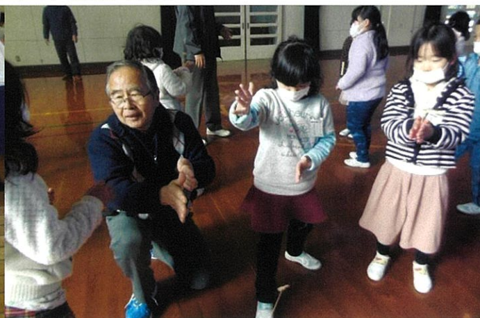
昔の遊びを教わろう(和田岡小)