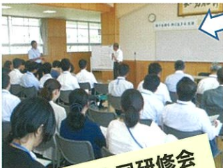
保幼小中合同研修会