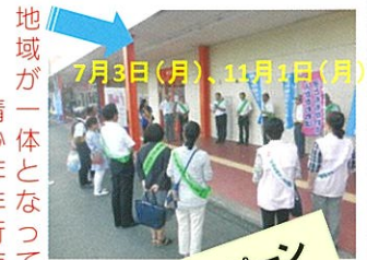
街頭キャンペーン