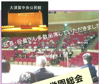
若つつじ学園総会