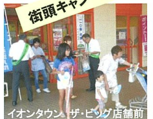
イオンタウン ザ・ビッグ店舗前