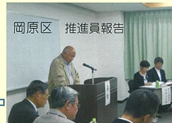
岡原区 推進員報告

テーマ【スマホ等使用における問題点】 毎回3地区合同で懇談会を実施しています 今回のテーマは子どもたちの提案で決定 スマホもゲーム機も親子での学校や地域での 勉強が必要(リスクの対応知識が大切) 小練習 行儀の作法についてアドバイスした 稲古場の履物整理や子ども同士の太鼓の練習 や物の片づけなどが自発的に出来る様になった