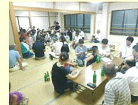
東西田町・大工町 懇談会