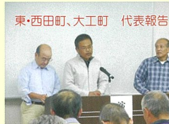
東・西田町、大工町 代表報告