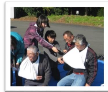
<地域防災訓練における中学生の活躍の様子>