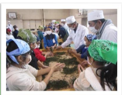
＜地域の方の協力によるお茶の手揉み体験の様子＞

教育段階の区切りを明確にし、6年生だけでなく、それぞれの段階で、責任感やリーダー性が発揮できる場を設定するよう努めます。また、小学生が中学生と関わることにより、さらに成長できる機会も多くあると考えています。