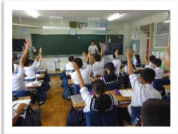
<自分から意見を話したくなる授業>

「やってみたい！」 「できた！」 という学びの意欲や喜びが もっと積み重なります